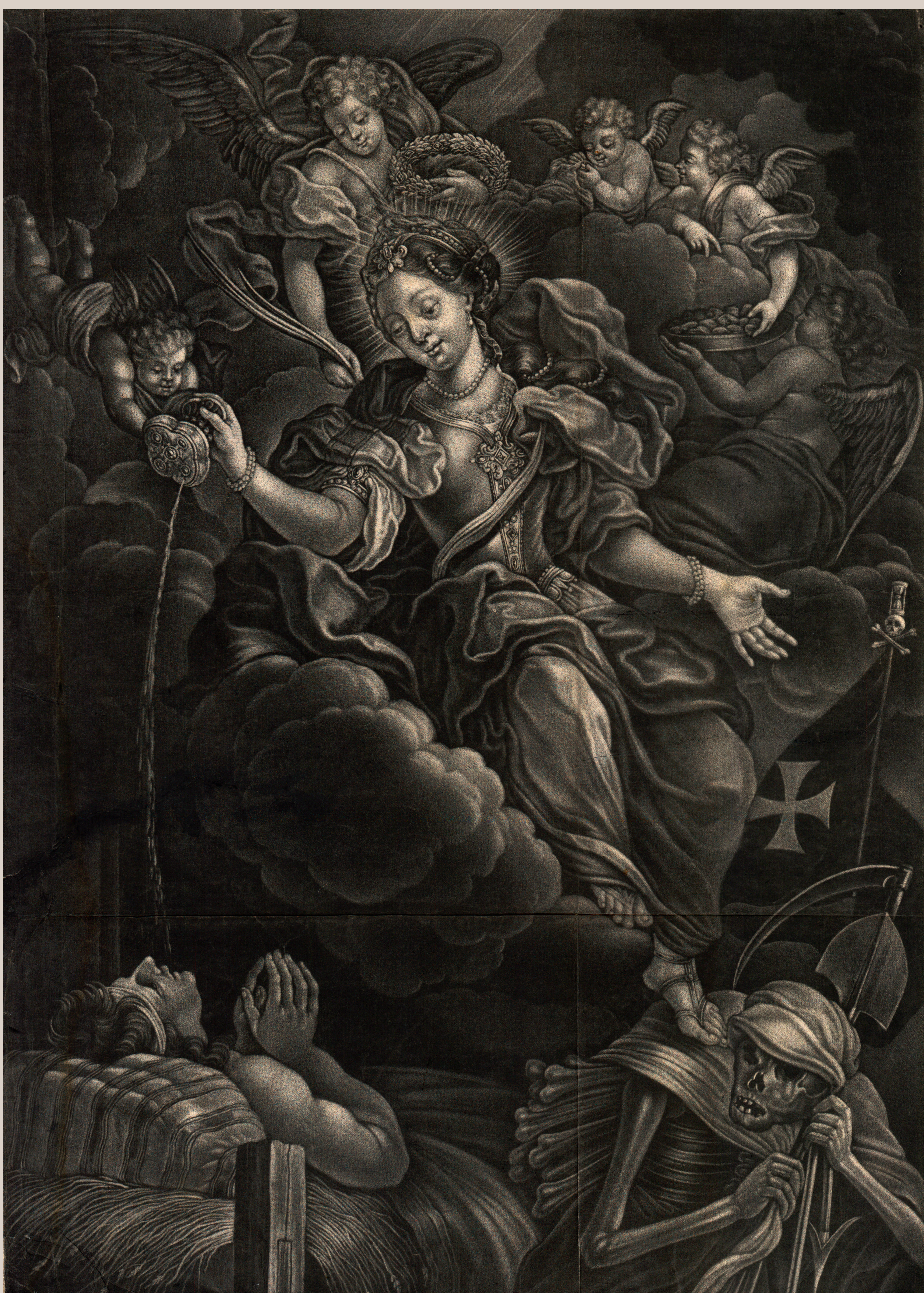
Antonín Freindt, Sv. Pavlína léčí nápojem ze své lampy, společná univerzitní teze bakalářů filozofie na olomoucké univerzitě, 1720, Zemský archiv v Opavě - pobočka Olomouc. Detail.

Výstava u příležitosti prezentace relikviáře sv. Pavlíny v kostele Panny Marie Sněžné 11. 6. – 24. 9. 2023